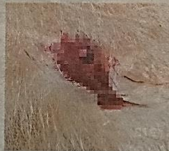
KESAN cedera pada badan seekor kucing akibat terkena peluru.

Dalam pada itu, seorang penduduk kampung itu yang