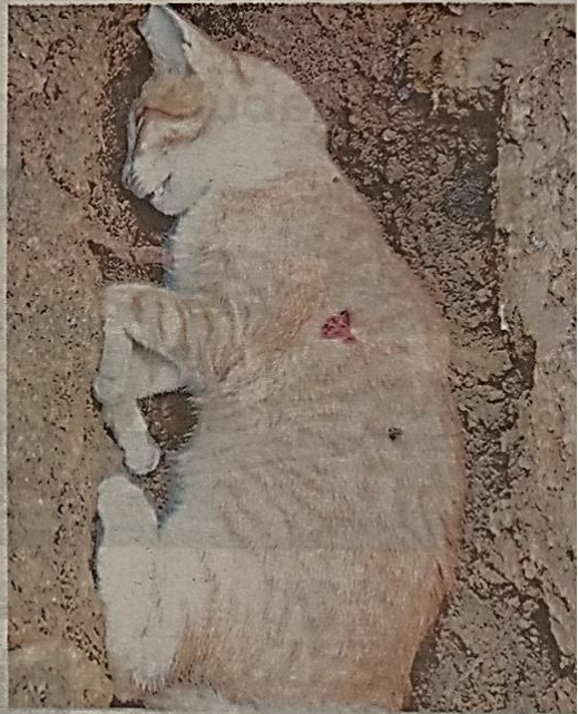
KUCING yang ditembak mati di Pintu Geng, Kota Bharu baru-baru ini.

"Susah nak percaya, sebab dia (suspek) seorang yang boleh bekerjasama sebelum ini," katanya ketika ditemui Kosmo! di sini semalam.